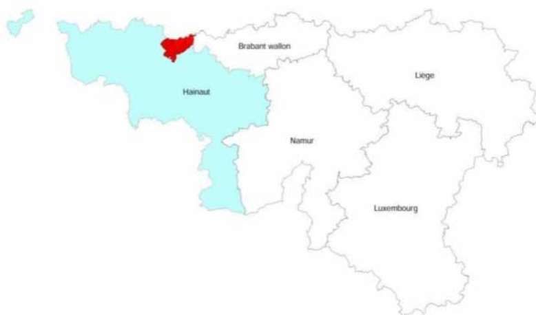
Beeld 1: Plaatsbepaling van de landinrichtingsomtrek Edingen

Op administratief vlak bevindt zich de, in onderstaande figuur in het rood ingekleurde, landinrichtingsomtrek “Edingen” in de provincie Henegouwen.