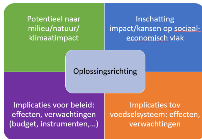
Figuur 1 Vierledig interpretatiekader voor het aftoetsen van structurele oplossingsrichtingen voor het mestbeleid