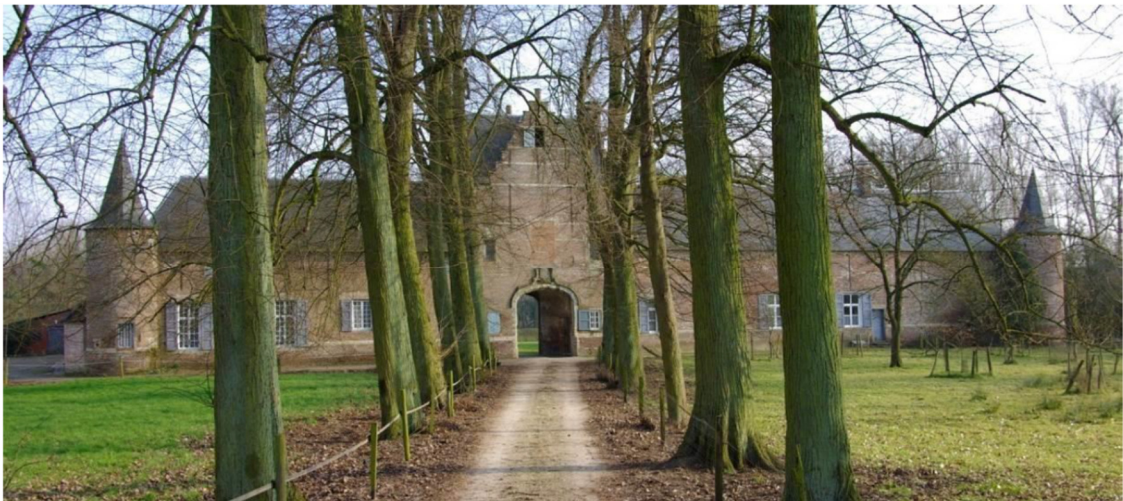
Zicht op het poortgebouw van de te verwerven Kasteelhoeve

Binnen het project is er werk gemaakt van een sterk grondbeleid, dat effectief ingezet kan worden om de doelstellingen van het project waar te maken. Voor het gebied ‘Graafweide-Schupleer’ is de herinrichting in volle uitwerking. Hiervoor is een sterke samenwerking opgezet tussen de betrokken partners, waarbij instrumenten en middelen worden samengelegd. Een inrichtingsvisie vormt de basis voor gerichte investeringen. Een proactief grondbeleid, een lokale grondenbank, een beheersovereenkomst met Natuurpunt en middelen van private partners, worden in het project slim gekoppeld aan investeringen en subsidies van de lokale partners, zoals de gemeente Grobbendonk en vzw Kempens Landschap. Ook de Vlaamse partners dragen hun steentje bij, zoals het Agentschap voor Natuur en Bos en De Vlaamse Waterweg. Op die manier is er zekerheid over de effectieve realisatie van de visie en doelstellingen in de vallei van de Kleine Nete.