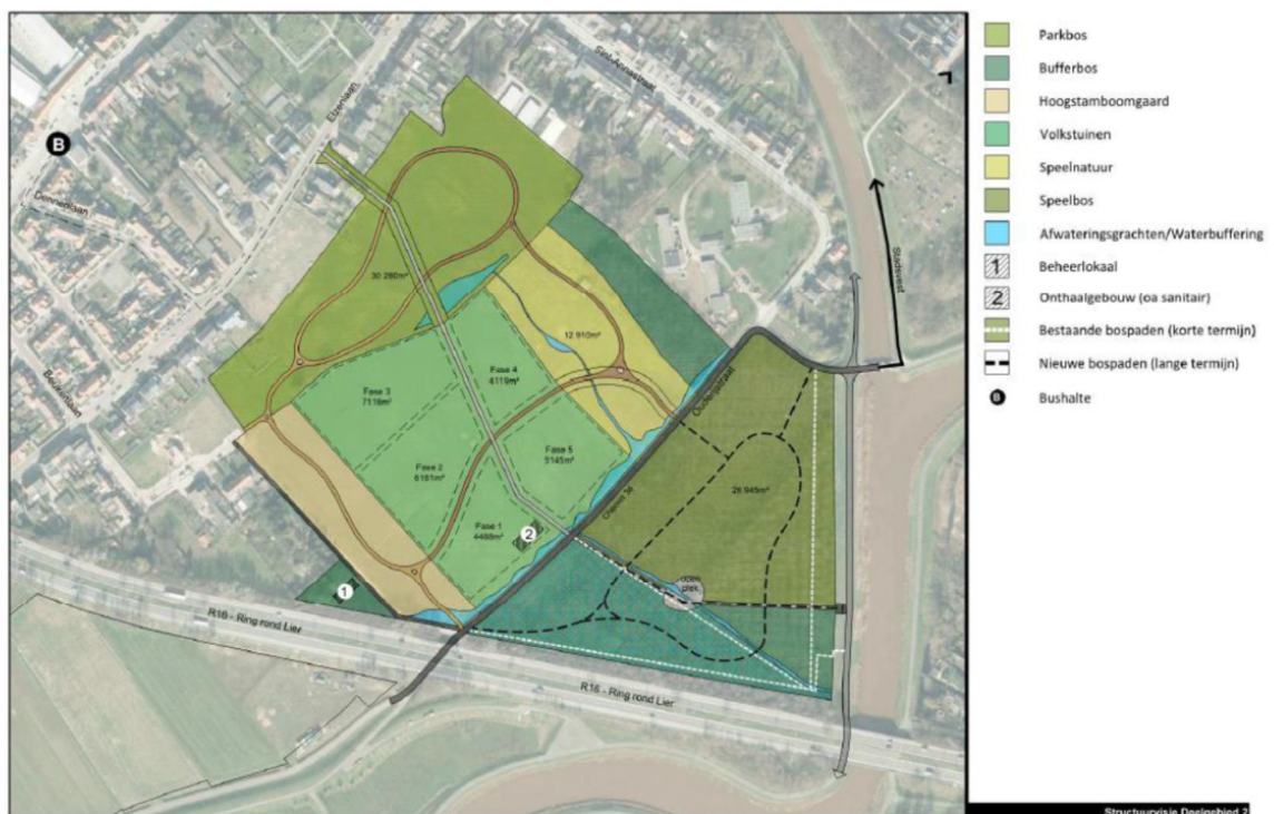
Figuur 17: Visienota landschapspark Pallieterland

Voor het grondbeleid in dit gebied worden middelen van diverse partners samengelegd, met stad Lier, OCMW, Polder van Lier en het Agentschap voor Natuur en Bos als belangrijkste. Voor te bebossen percelen wordt gebruik gemaakt van de subsidieoproep van Agentschap voor Natuur en Bos en de middelen uit het boscompensatiefonds. De stad Lier heeft het engagement opgenomen om alle andere gronden die het openruimtegebied zullen vormen, stapsgewijs aan te kopen en in te richten als landschapspark. Voorliggende subsidie ondersteunt bijgevolg de gehele aankoopstrategie, om via deze financiële bijdrage méér gronden te kunnen verwerven en een groter deel van het landschapspark Pallieterland op korte termijn effectief te kunnen realiseren.