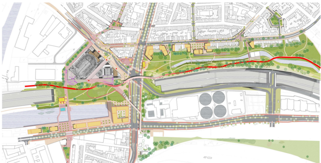
Eindbeeld scrumsessie Ringpark het Schijn met suggestie van nieuwe toegangen tot het Ringpark

Het project illustreert de relatie tussen het geheel van de 'Ringzone' en de strategie voor de realisatie enerzijds en het grondbeleid dat de kern vormt van het strategisch project anderzijds. De realisatie van het Ringpark Schijn is in zijn globaliteit strategisch van aard. De aanpak om te starten met de (hoofd)toegangen is realistisch. Het zal een hefboom vormen voor het strategisch project en voor de aanpalende stadswijk. Deze subsidie zal de kernactoren (stad/autonoom gemeentebedrijf, andere) in staat stellen te beschikken over de strategisch gelegen gronden en constructies, waarmee een opening door het woonblok kan worden gemaakt en een eerste hoofdtoegang naar Ringpark 't Schijn worden gerealiseerd.