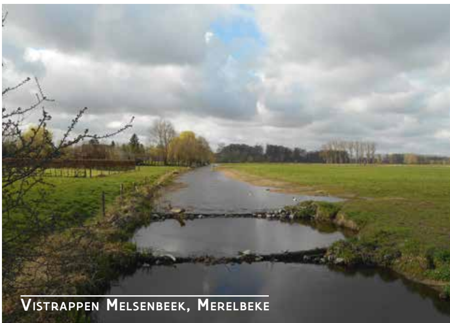
VISTRAPPEN MELSENBEEK, MERELBEKE