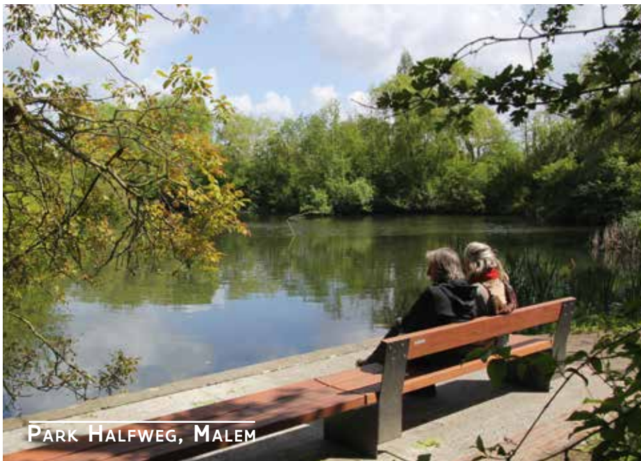
PARK HALFWEG, MALEM