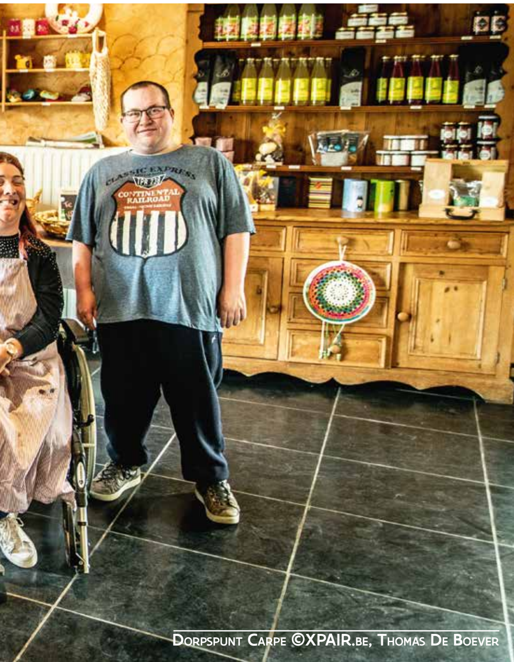
DORSPUNT CARPE