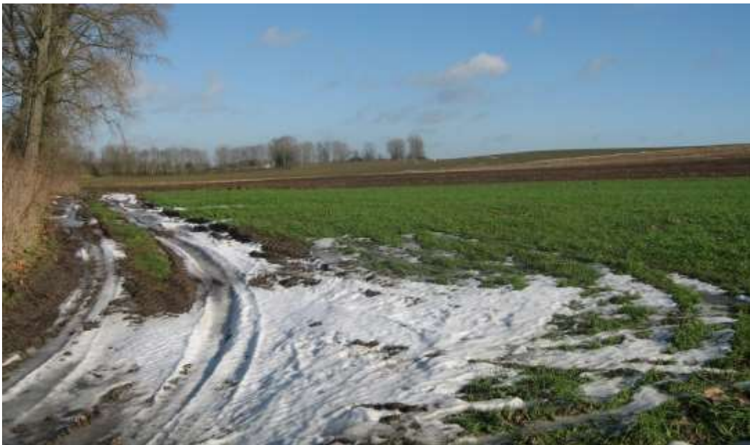
Zicht in noordoostelijke richting vanaf de Aalstsesteenweg ter hoogte van de noordgrens van het gebied. Enkel het gedeelte meest rechts op de foto (akkerland) behoort tot het plangebied.