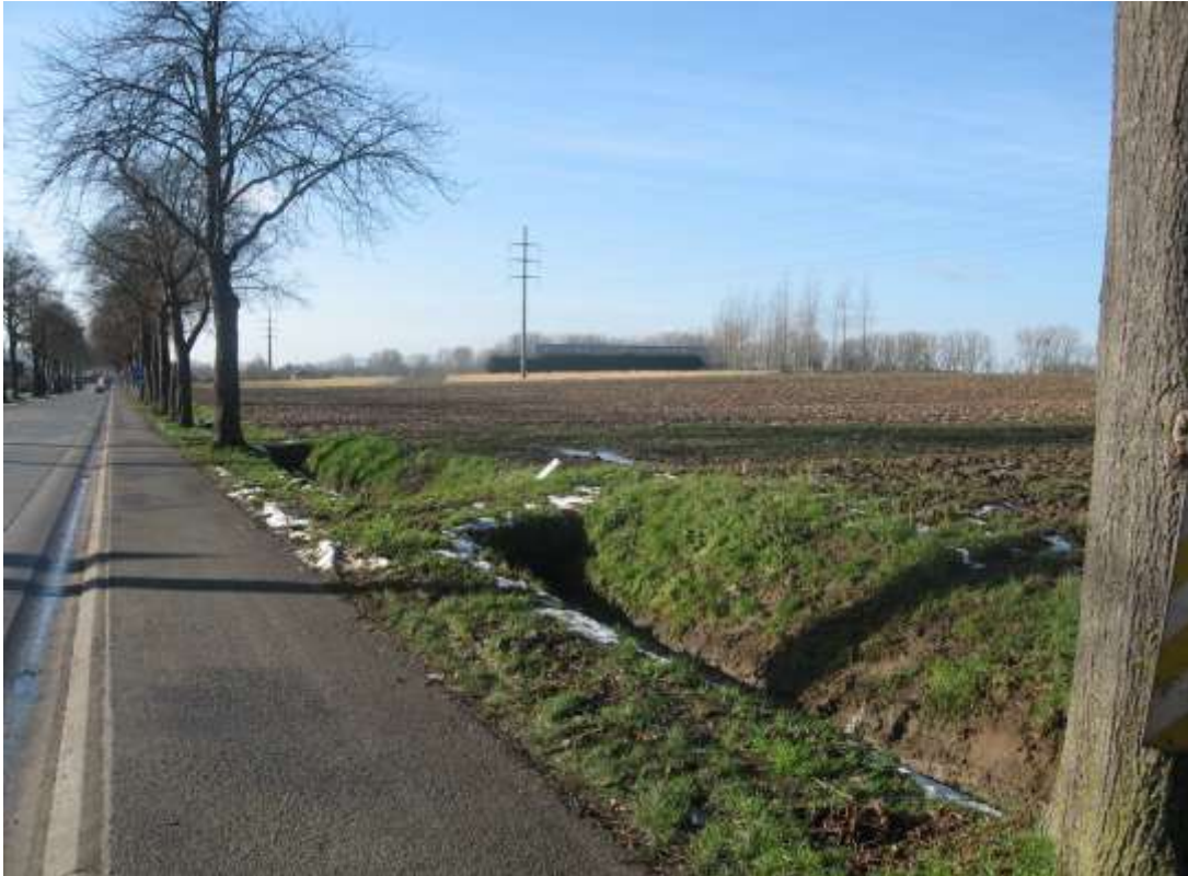
Zicht in westelijke richting op de zuidgrens (langsheen de Astridlaan) van het plangebied. Rechts van de foto situeert zich de rij woningen die buiten het plangebied gelaten zijn. De grote landbouwloodsen in het midden behoren tot een grootschalig landbouwbedrijf buiten het plangebied gelegen langsheen de Aalstsesteenweg.