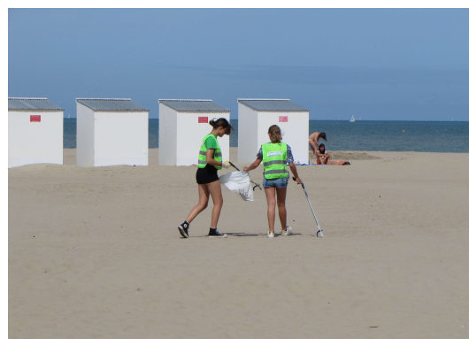
Strandopruimactie bij de Federal Truck in Koksijde

4.3.5 Aanmoedigen en ondersteunen van lokale overheden, organisaties en ngo's bij de organisatie van opruimactiviteiten op het strand.