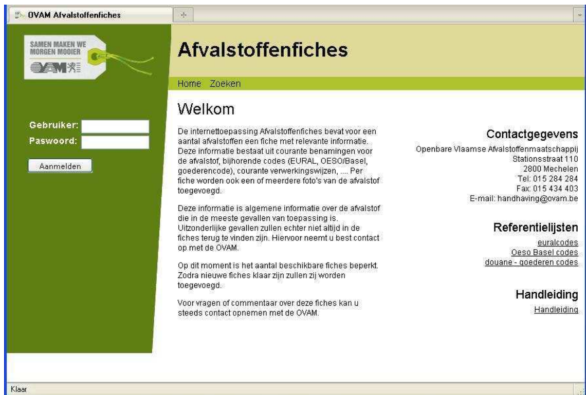
Figuur 1: Start scherm

In het linkse menu kan je inloggen met dezelfde login-gegevens van de Inspectietoepassing.